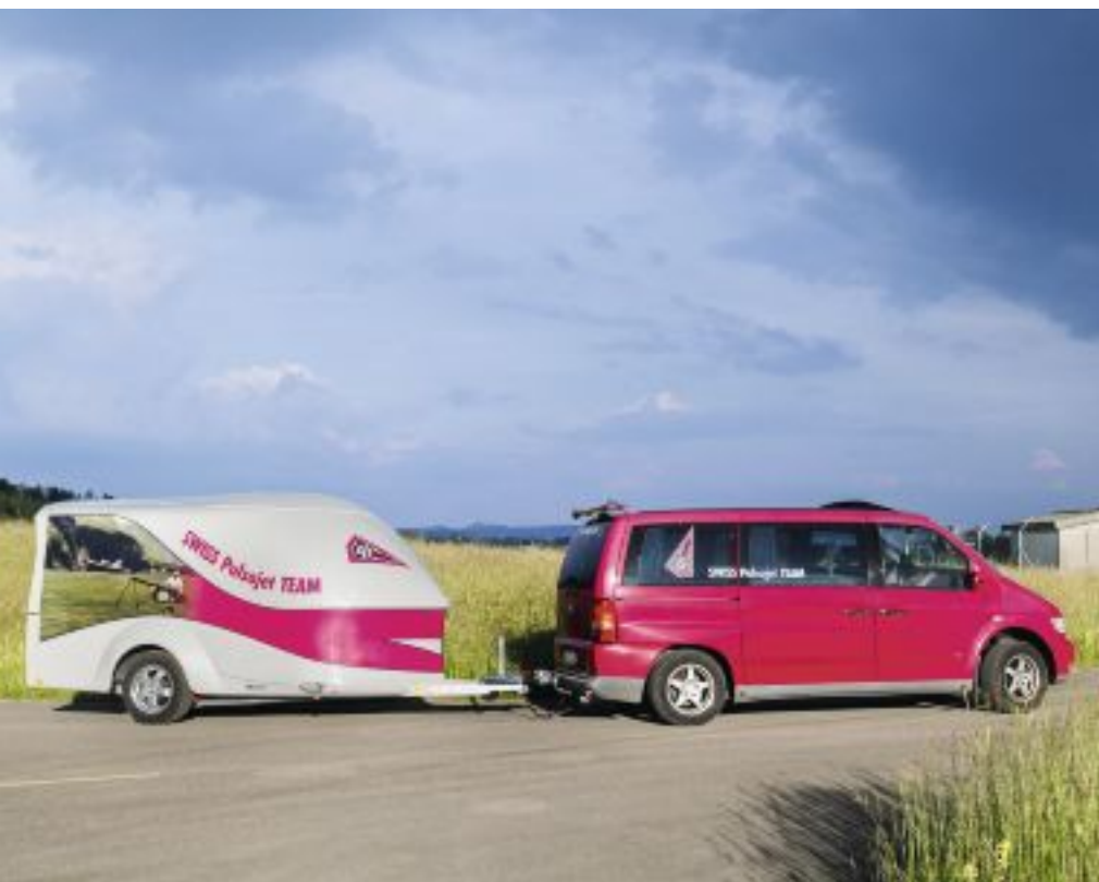
Transportbus mit Anhänger, auch im Teamdesign.

On a déjà pu voir des spectateurs se renseigner sur d'éventuelles possibilités de rétribution dans ces présentations d'«air shows», mais Rogers a dû les décevoir. Comme tant d'autres hobbies, l'aviation «pulsée» s'accompagne de lourds déficits, surtout lors d'apparitions à des meetings aériens en Amérique ou Asie. Souvent aussi, il faut consentir à de longs déplacements à travers la moitié de l'Europe, nécessitant beaucoup de temps et générant des frais considérables, chaque fois entièrement assumés par le team. Le Pulsoteam présente principalement ses démonstrations pour offrir bonheur et divertissement aux foules de spectateurs fascinés par cette disci-