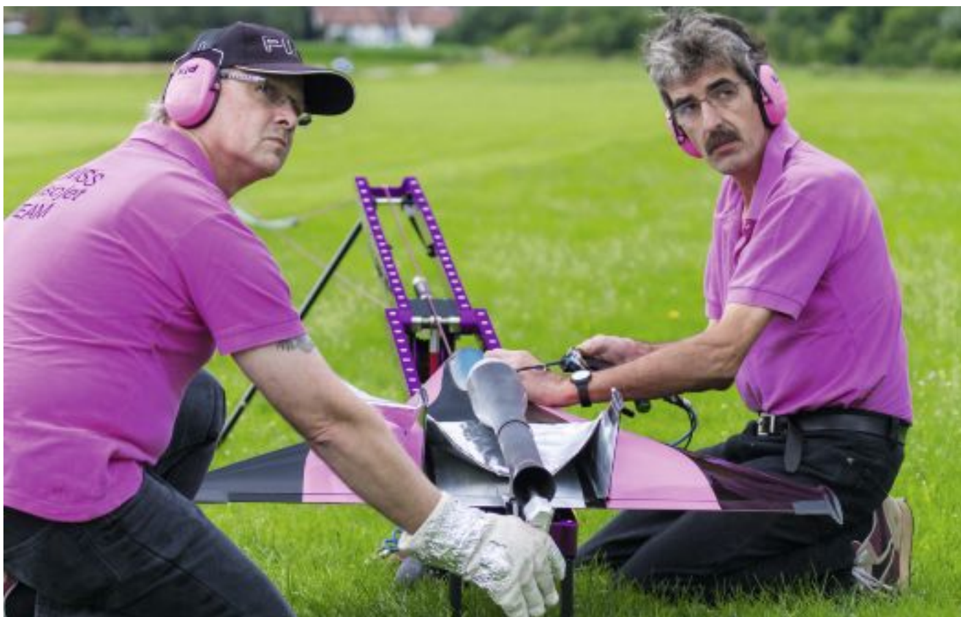
Startrampe mit dem Seilzug, ein vom Team selbst gefertigtes Unikat.

Rampe de lancement avec son câble de traction: pièce unique réalisée par le team lui-même.