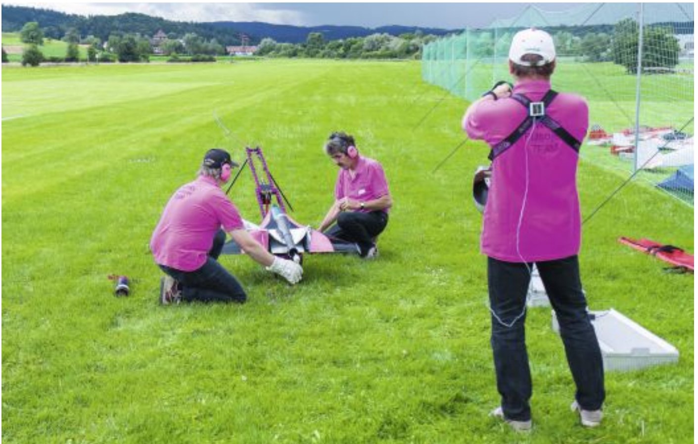
Das Pulso-Team konzentriert sich auf den Start.