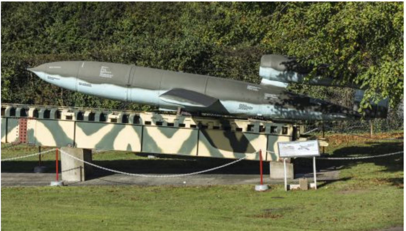
Fieseler-Rakete Fi 103 (V1) auf Startrampe (IWM Duxford/GB).