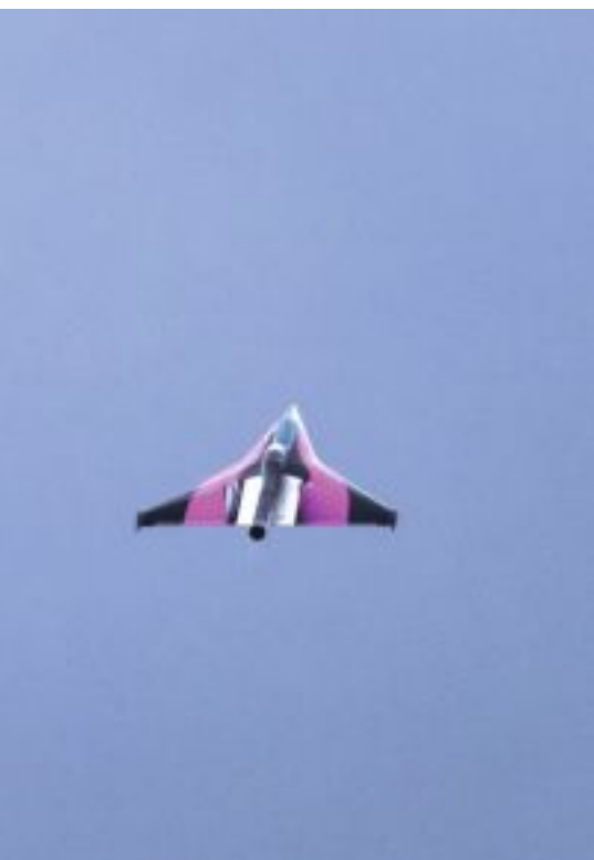
Jet im rasanten Steigflug. Le jet grim pant en trombe.

Rampe de lancement avec son câble de traction: pièce unique réalisée par le team lui-même.